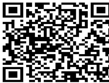
和田县 2022 年教师招聘（甘肃组）