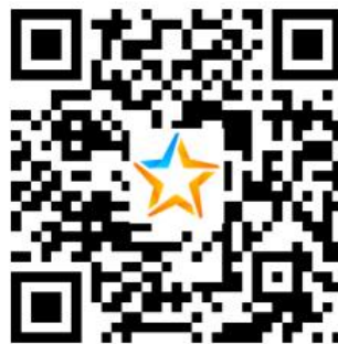
洛浦县教育局教师招聘四川组