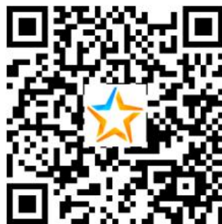
洛浦县教育局教师招聘内蒙古组