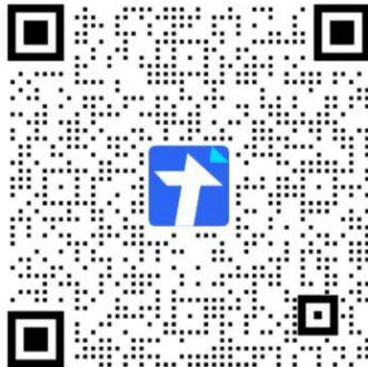
墨玉县教师招聘河南组