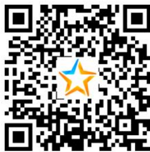
洛浦县教育局教师招聘甘肃组