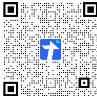
墨玉县教师招聘四川组