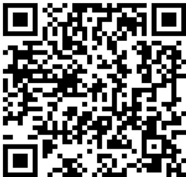
和田县 2022 年教师招聘（四川组）